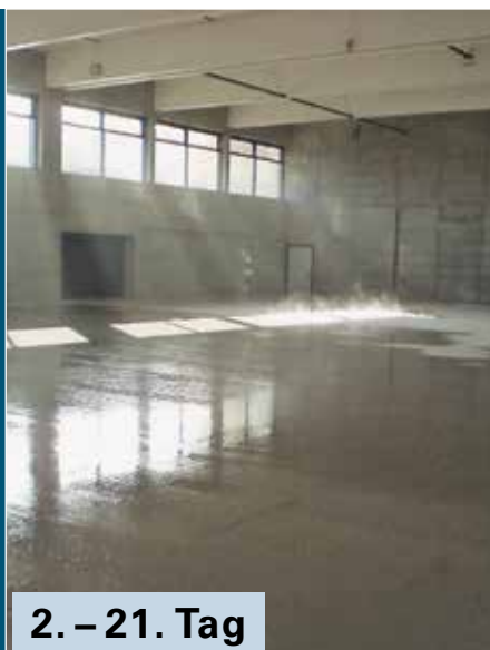
2. – 21. Tag